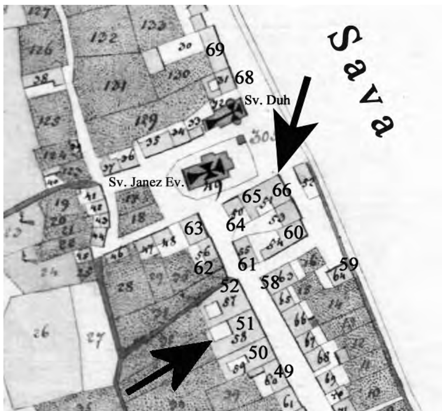
Izsek katastrske mape iz leta 1825 z dodanimi rektifikacijskimi številkami; spodnja puščica kaže pravo Valvasorjevo ob glavni krški ulici (južni del Mencingerjeve), zgornja pa napačno, t. i. Valvasorjevo hišo v uličnem otoku.

registru iz leta 1756) 184 brez težav preslikamo na katastrsko mapo iz leta 1825. Izkaže se, da so bile hiše, označene kot zidane sredi 18. stoletja, takšne tudi v času franciscejskega katastra. V obeh časovnih izsekih pa se le enkrat skupaj pojavijo tri velike zidane hiše, in to obakrat na istem mestu ob glavni ulici: že omenjene hiše na stavbnih parcelah 57–59. Leta 1752 so z letnim donosom