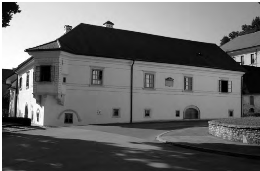
Napačna Valvasorjeva hiša v Krškem s spominsko ploščo iz leta 1894 – nekdanja Hohenwartova hiša, združena iz dveh nekoč samostojnih hiš

je naš slavni povestničar umrl v Krškem. Če je pa res tukaj umrl, bi se vsaj sedem izmed starejših hiš potegovalo za to čast, katero je pred nekaj leti ta spominska plošča tako iznenada in brez natečaja poklonila mestni hiralnici, ki za Valvasorja ni še bila hiralnica. Če stvar premotrimo z edino pravega, to je praktičnega stališča, se nam vidi tista plošča prav umestna. Sedem grških mest si je prisvajalo rojstni dom divnega Homerja. Da je takrat prebrisana glava na katerikoli hiši tistih sedmih mest vzidati dala marmor z zlatim napisom: "V tej hiši se je rodil Homer dne 1. aprila leta 800 pred Kristusovim rojstvom", koliko bi to bilo koristilo vsemu omikanemu svetu! Ne bi bilo prepira med sedmimi mesti. Še zdaj bi marsikateri učenjak romal k Homerjevi zibki, kakor roma k Vergilovi rakvi v Neapelj-Partenope, in noben učenjak bi se ne bil predrznil sprožiti predrzne domneve, da Homer kakor pesnik celotne Iliade in celotne Odiseje niti živel ni. Mi Krčani smo prekosili stare Grke; kajti v marmor je