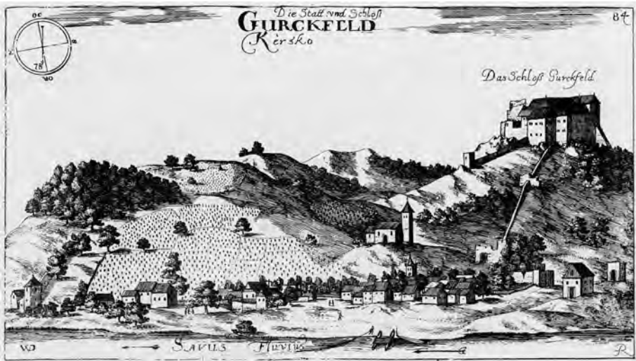
Krško po Valvasorjevi Topografiji Kranjske iz leta 1679 (Valvasor, Topographia Ducatus, št. 84)

namene šele od srede 20. stoletja, ko ga je ljubljansko okrožno sodišče izročilo osrednjemu slovenskemu arhivu (1948), 45 raziskovalci preteklosti Krškega in Valvasorjeve hiše pa bi lahko že veliko prej segli po gradivu krškega župnijskega arhiva. A tudi če se je kdo lotil matičnih knjig, je brez opore v katastru in drugem mlajšem gradivu moral hitro odnehati. Enako kot danes so bile namreč že v začetku 20. stoletja dobro ohranjene samo krstne matice, ki sežejo brez vrzeli do leta 1670 in torej zajamejo še krst zadnjega Valvasorjevega otroka (1693). Poročne matične knjige se začenjajo leta 1713, najstarejša ohranjena mrliška pa šele leta 1771, zato tudi ne poznamo datuma Valvasorjeve smrti ali pokopa. 46 Če je kdo pred nami iskal v maticah podatke