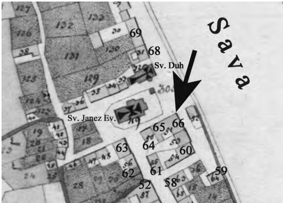
Izsek katastrske mape iz leta 1825 z dodanimi rektifikacijskimi številkami; puščica kaže napačno Valvasorjevo hišo.