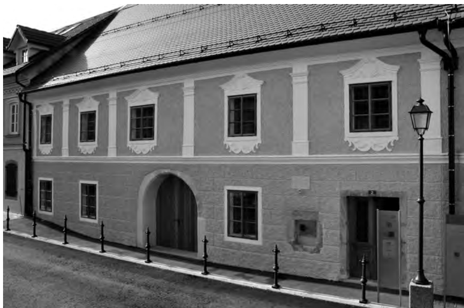
In po končani prenovi (foto: Nina Sotelšek, oktober 2013)