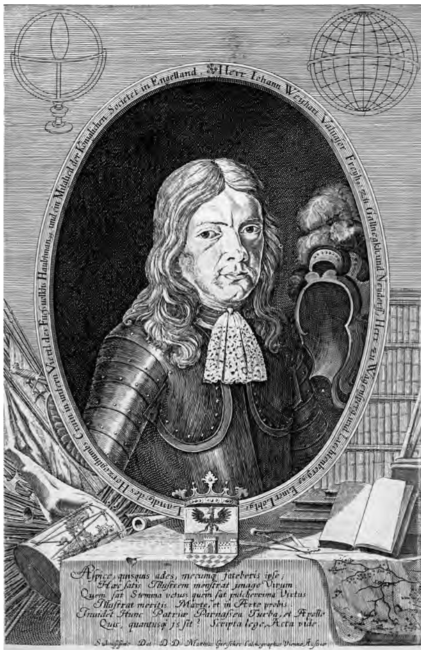
Matija Greischer, portret Janeza Vajkarda Valvasorja, Die Ehre des Hertzogthums Crain, 1689