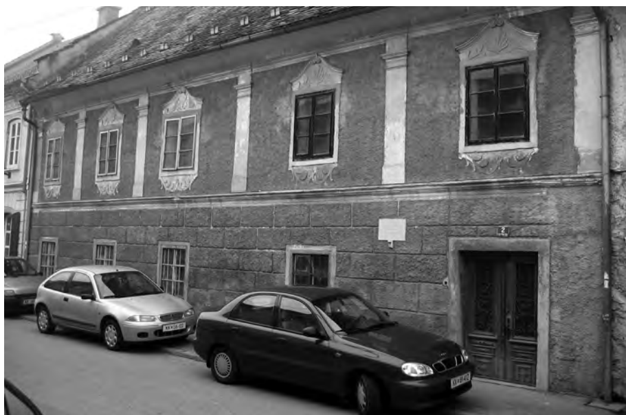
Prava Valvasorjeva hiša, poznejša Zetschkerjeva, je današnji južni del Mencingerjeve hiše, združene iz dveh stavb. Pred prenovo (foto: Boris Golec, december 2006)