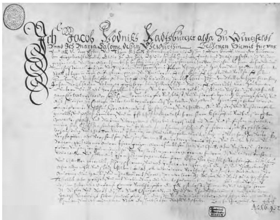
Izvirna listina o prodaji Vodnikove hiše v Krškem Janezu Vajkardu Valvasorju, Krško, februar 1693 (ARS, AS 1063, Zbirka listin, a. e. 2742)

novo zgrajenim poslopjem stoji med dvema hišama z vrtovoma, katerih lastnika sta ugledna krška meščana. Takoj je bilo jasno, da t. i. Valvasorjeva hiša na vogalu med Valvasorjevim nabrežjem in Hočevarjevim trgom nika- kor ne ustreza opisoma v listini o kupo-prodaji ter v polihistorjevem zupu- ščinskem inventarju. Pri določitvi dejanske Valvasorjeve hiše pa sem se v prvi vrsti naslonil na podatke o novem lastniku, ki mu je vdova hišo prodala, in na dejstvo, da viri o tem človeku prenehajo, tik preden so baroni Zetscherjji leta 1717 kupili hišo, ki jo je brez težav mogoče locirati. Njena lega in velikost se povsem skladata s podobo Valvasorjeve hiše, kot jo ponuja vsebina ome- njene listine iz leta 1693. Nepogrešljivi referenci za določitev polihistorjevega