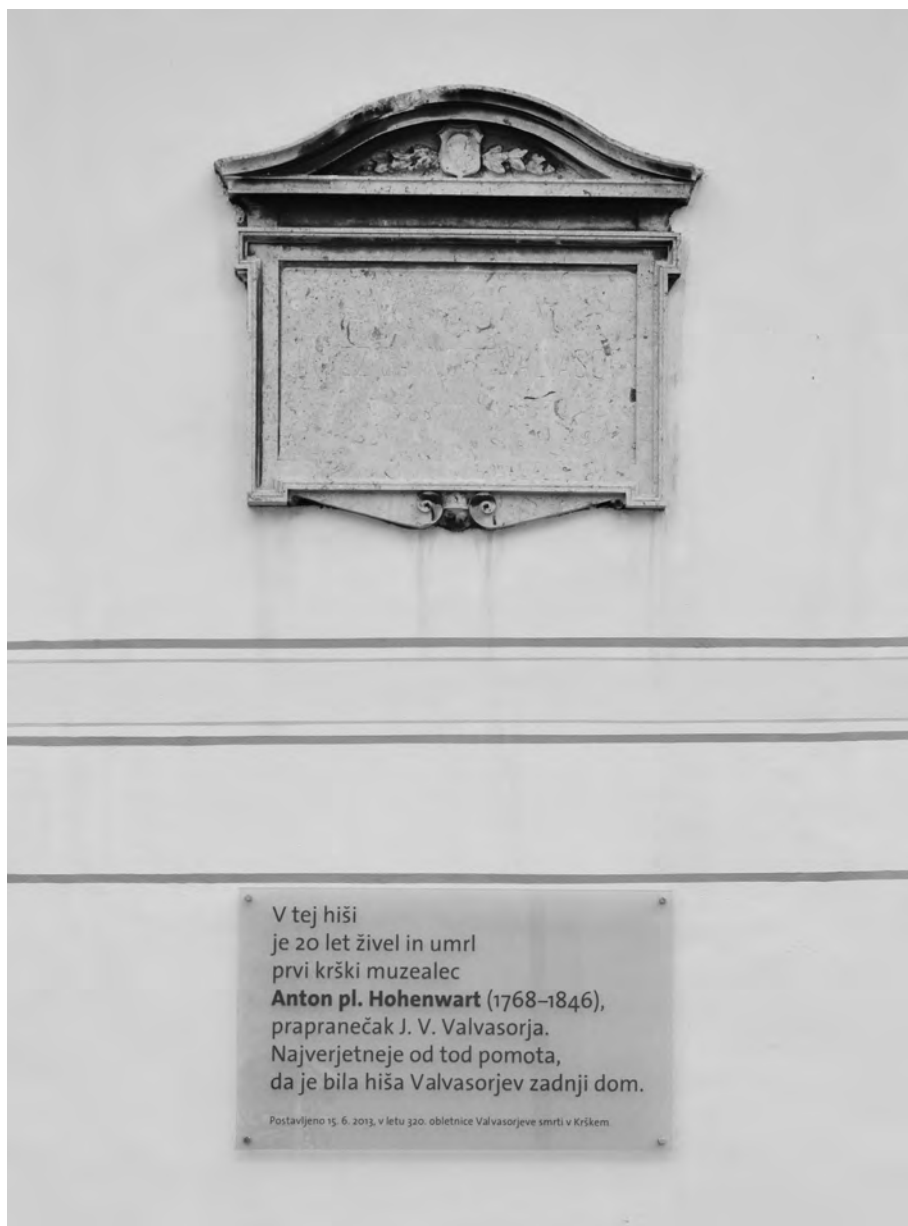
Dve plošči na napačni Valvasorjevi hiši, prva iz leta 1894 in druga iz leta 2013