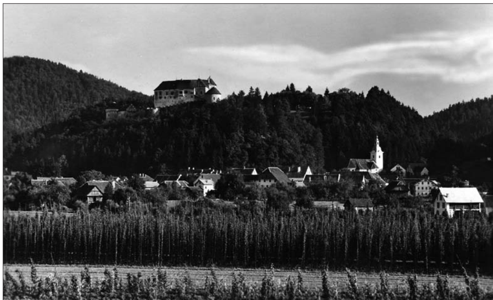
Slika 3: Razglednica Velenja iz okoli leta 1940, ki prikazuje nekoliko vzpeto območje trga Velenje, nad katerim se vzpenja hrib z mogočnim velenjskim gradom (avtor neznan).

Ob občinskem prazniku leta 1963 je Velenje tudi formalno postalo središče Šaleške doline (Poles 1999). Leta 1952 postane mestna občina, nekdanja občina Šoštanj pa se leta 1963 preimenuje v občino Velenje,