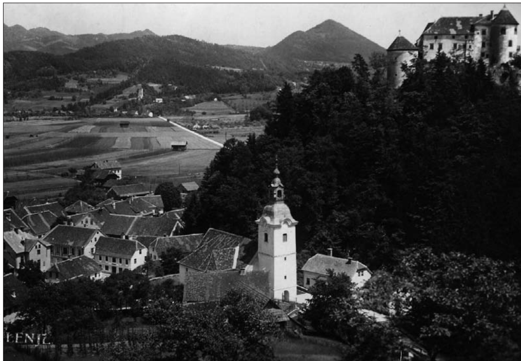
Slika 2: Razglednica iz leta 1938, ki prikazuje trg Velenje z gradom ter ravninski del, kjer se danes nahaja center Velenja ob Šaleški cesti proti gradu Šalek (avtor neznan).