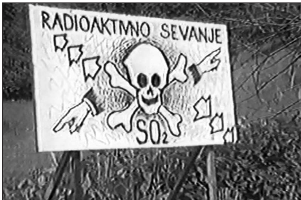
Slika 3: Ozaveščanje širše javnosti o načrtovani gradnji odlagališča radioaktivnih odpadkov v Velenjski kotlini pred naseljem Zavodnje.

V razgibano dogajanje je pozimi 1986/87 pricurljala novica, da na skrajnem severnem delu takratne občine Velenje, zdaj občine Šoštanj, potekajo terenska raziskovanja (vrtanja) za potrebe odlagališča nizko in srednje radioaktivnih odpadkov (v nadaljevanju NSRAO) iz Nuklearne elektrarne Krško (v nadaljevanju NEK). Delavci na vrtinah so sami povedali domačinom kaj počnejo. Iz gostilne Pri Rihterju v Spodnjem Razborju je prišla informacija v Velenje. Na lokacijo je šlo več skupin. Med drugimi so opuščeno delovišče fotografsko dokumentirali člani fotokluba Zrno. Spontano se je povečal odpor tudi zaradi