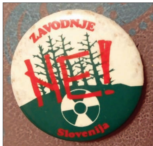
Slika 5: Priljubljeno priponko sta oblikovala in izdelala Pec Rihtarič in Ac Sagmeister (studio ACPC), ki je sicer skrbel za grafično podobo Kina 16 in S/tiskarne.