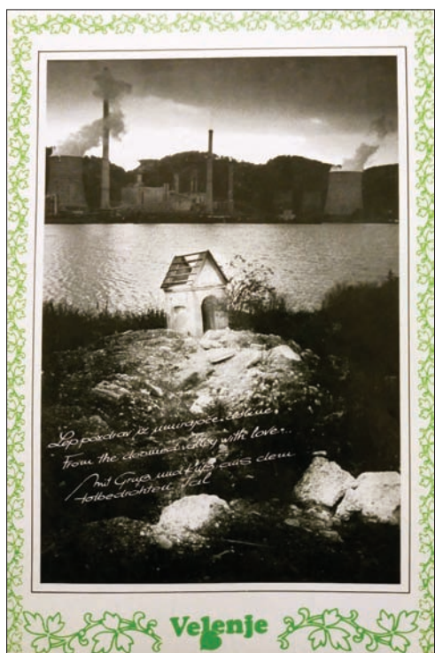
Slika: 2: Razglednica iz serije Pozdrav iz umirajoče doline (produkcija Fotoklub Zrno Titovo Velenje 1986).

Čez noč se prebudila ekološka zavest in se prelevila v spontano, a stihijsko protestno gibanje. Socialistična zveza delovnega ljudstva (SZDL), kot inštitucija, je sicer skušala gibanje usmeriti pod svoje okrilje, a ji ni dobro uspelo zaradi prebujenih družbenih gibanj v tem obdobju. V rudarskem spalnem Velenju pa je protestno gibanje poganjalo več kulturnih skupin, ki so sledile nemirnemu dogajanju v Zavodnjah. Ekološka vprašanja, tudi za nazaj in zaradi njihovih posledic, so začeli odpirati v formi kul-