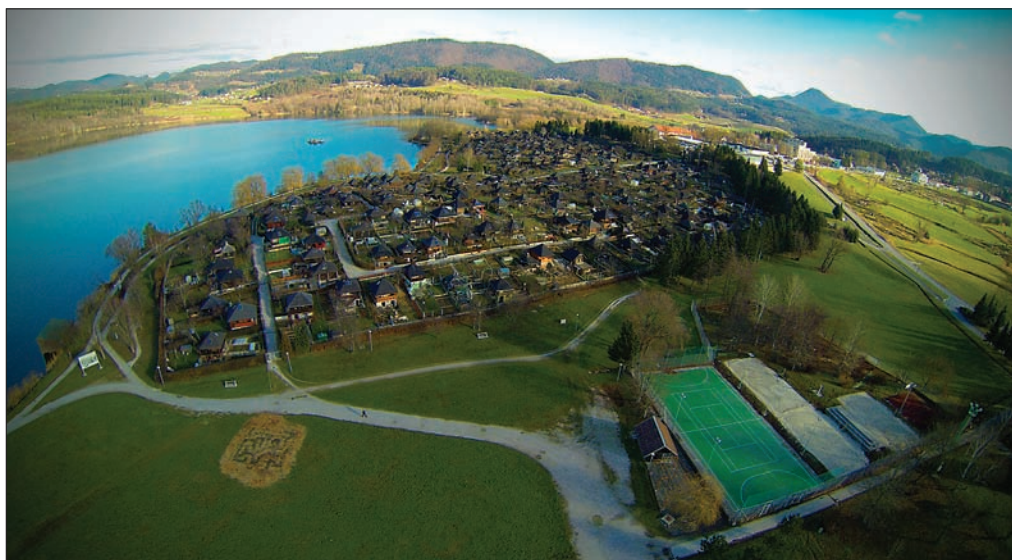
Slika 2: Panorama vrtičkarskega naselja Kunta Kinte v Velenju.

Premogovnik je začel v večjem obsegu reaktivirati zemljišča že pred okoljsko krizo, večinoma v območja za rekreacijo. Na pobudo prebivalcev, ki so se zvečine priselili s podeželja in so imeli izkušnje z obdelovanjem zemlje in samooskrbo, so zagotovili prva večja območja za vrtičkarstvo (Nenavadno vrtičkarsko naselje ... 2011; Lovšin 2014). Premogovnik je sicer prva zemljišča za obdelovanje dal v najem