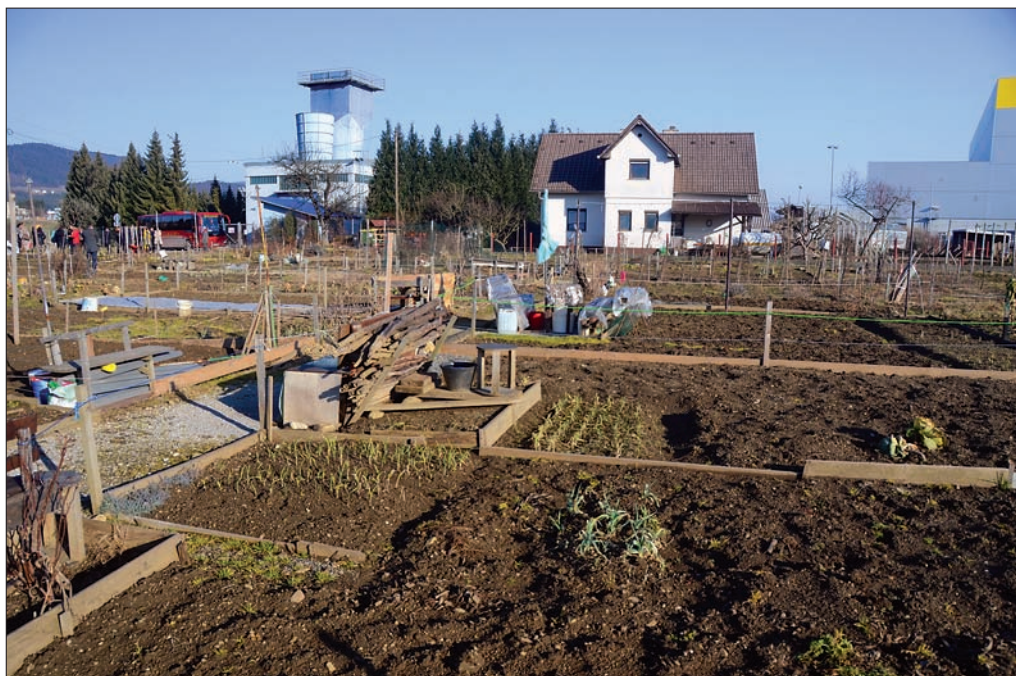
Slika 4: Najemni vrtovi Kranjca v Bevčah.