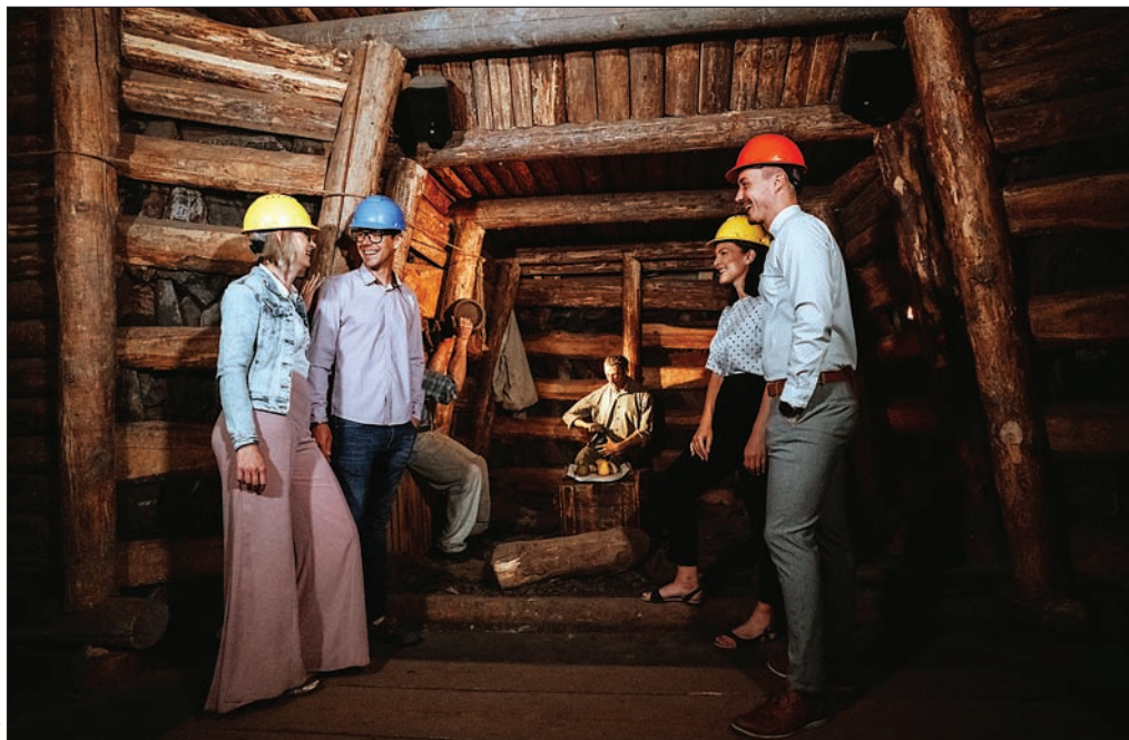
Slika 6: V Muzeju premogovništva Slovenije obiskovalci doživijo razvoj premogovništva skozi čas.