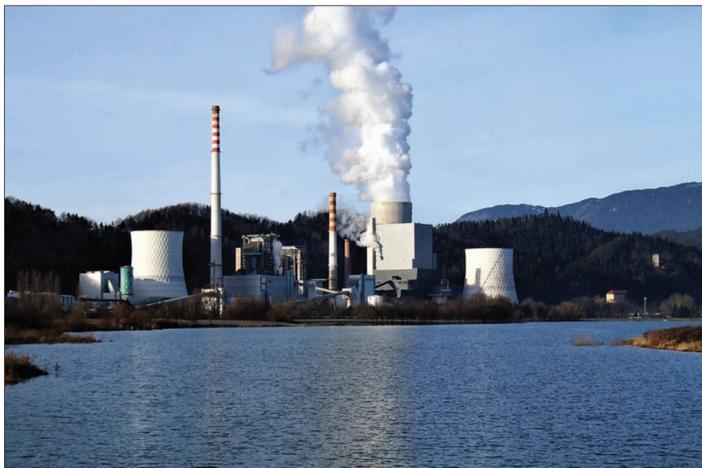
Slika 2: Premogovnik Velenje z lignitom oskrbuje Termoelektrarno Šoštanj.