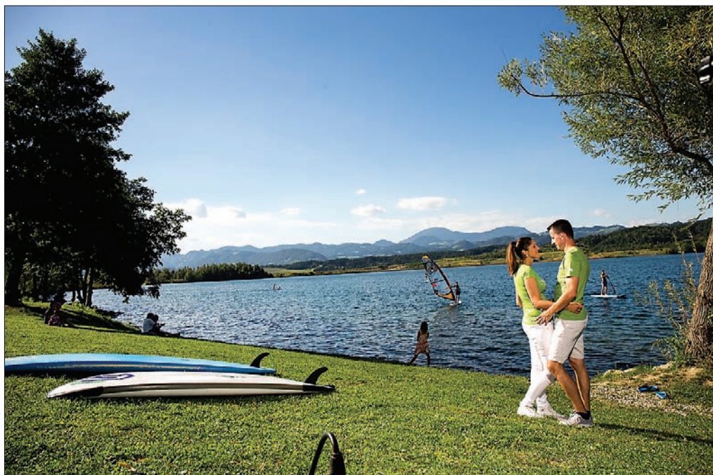
Slika 7: Velenjska plaža. Na južni obali Velenjskega jezera je Velenjska plaza s številnimi vsebinami.