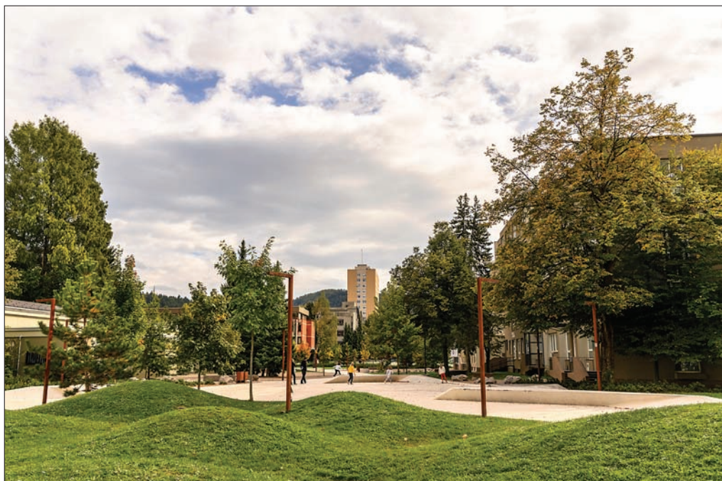
Slika 3: Tovarna Gorenje je nastala v vasi Gorenje po nacionalizaciji Špehove kovačije leta 1950.