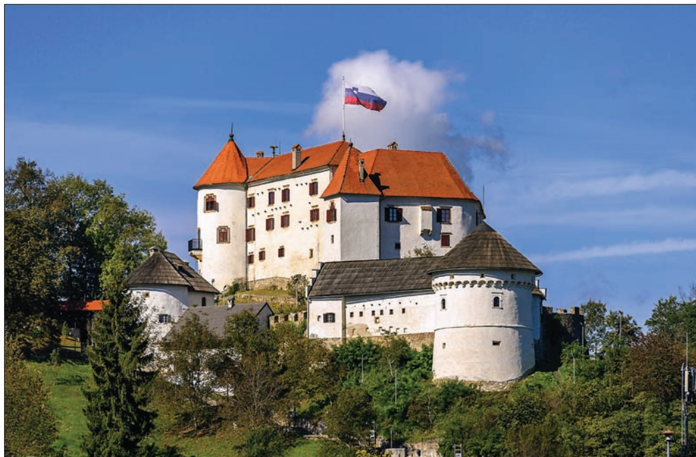
Slika 1: Velenjski grad je današnje podobo renesančnega dvorca – palacia dobil v 16. stoletju.