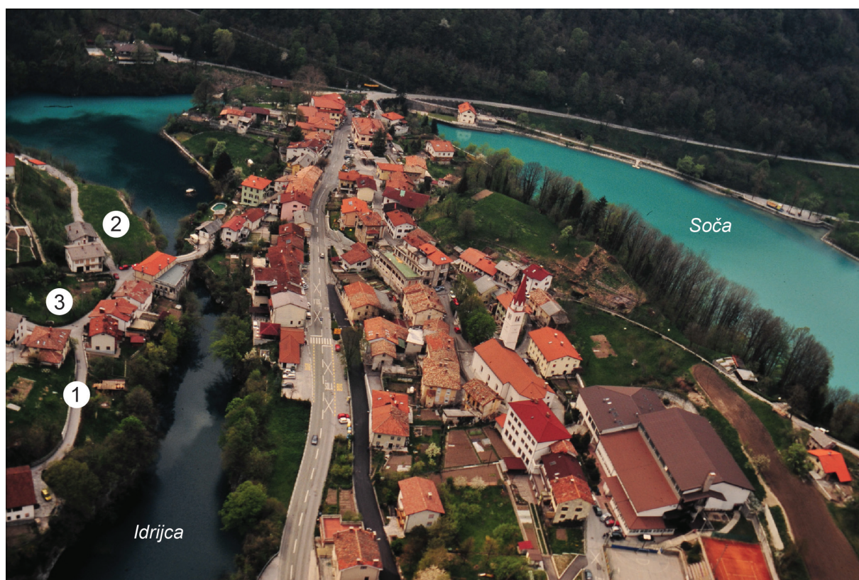
Sl. 1: Zračni posnetek Mosta na Soči z lego najdišč Pucarjev rob (1), Repelc (2) in Lipičarjev vrt (3), pogled z vzhoda. Fig. 1: Westward aerial view of Most na Soči with marked sites at Pucarjev rob (1), Repelc (2) and Lipičarjev vrt (3).