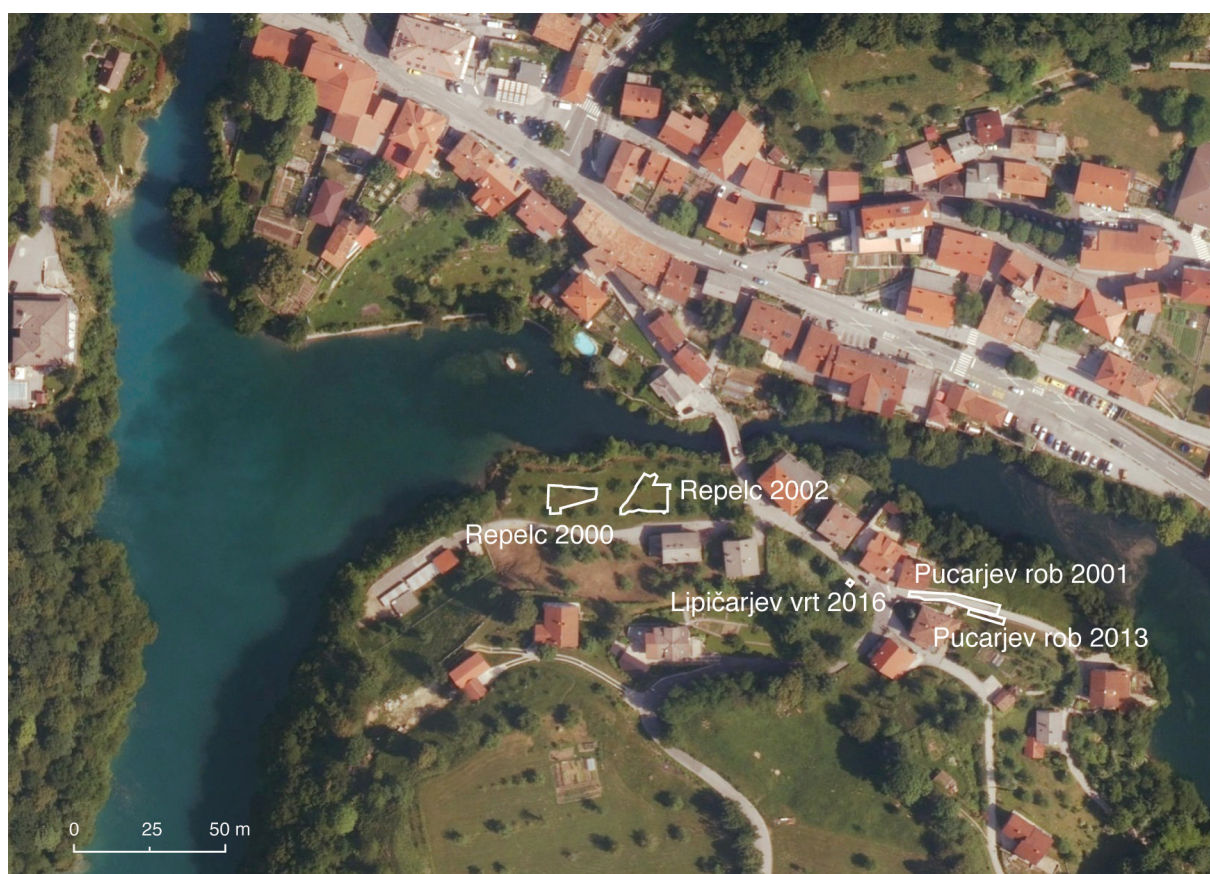
Sl. 2: Most na Soči. Območja arheoloških raziskav na najdiščih Repelc (2000 in 2002) in Pucarjev rob (2001 in 2013) ter lega groba na Lipičarjevem vrtu (2016). M. 1:2500.