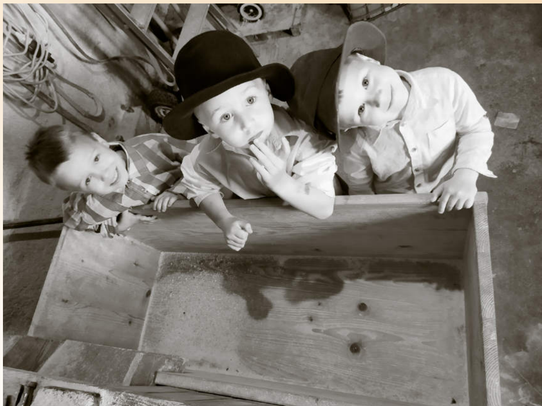
Radovedni otroški pogledi v starem mlinu. Predšolski otroci iz Otroškega vrtca Ajdovščina, Enota Ribnik, skupina Rdeče pike. Foto: Klavdija Mikuš, Ajdovščina, maj 2021.