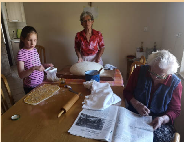
Stik generacij pri ohranjanju kulturne dediščine in prenosu tradicionalnih znanj. Foto: Anamarija Cotič, dijakinja Srednje šole Veno Pilon Ajdovščina, maj 2020.

V strokovnih krogih zato pravimo, da je dediščina izpogajan in dinamičen koncept. Njeno osrčje predstavljajo kulturne prakse (praznovanja, raziskovalne aktivnosti, projekti, priprava razstav, prireditve, oživljanje tradicije ali zgodovinskih dosežkov, festivali ipd.), v katerih se posredno odvijajo tudi procesi izpogajanj kolektivnih vrednot in pomenov, ki jih skupnost pripisuje materialnim in nematerialnim elementom dediščine (Smith 2006, Fakin Bajec 2011).