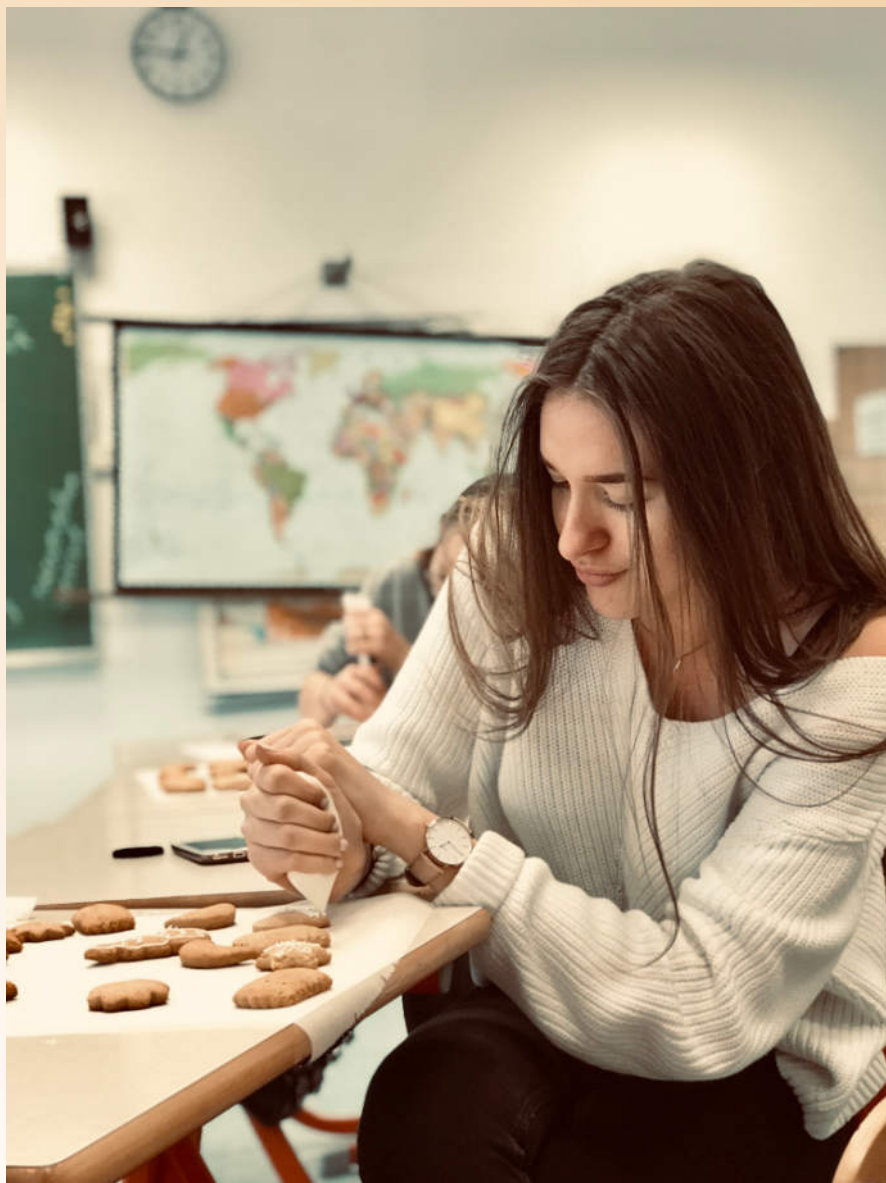
Utrinek iz delavnice Peka medenjakov na Srednji šoli Veno Pilon Ajdovščina. Foto: Melita Lemut Bajec, december 2019)