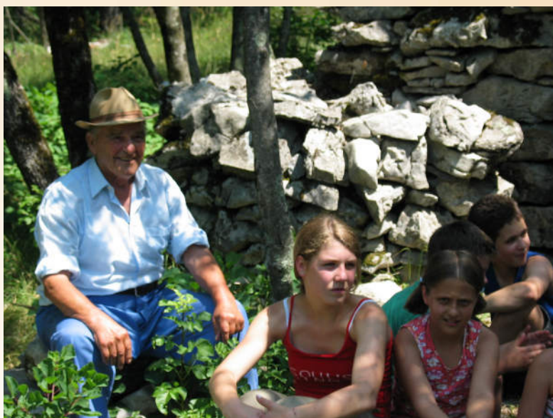
Pogovor o načinu življenja na Krasu ob snemanju dokumentarnega filma Takú je blo na Volčjem Gradi! (2005).