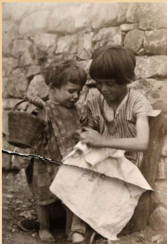
Otroci na Krasu leta 1926.