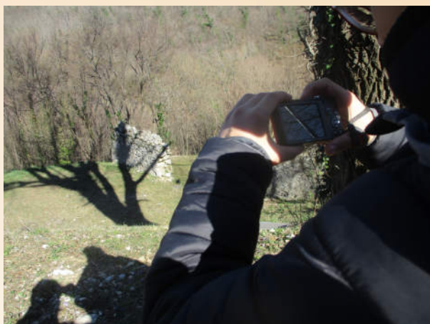
Utrip iz delavnice, izvedene leta 2018 z učenci 3. razreda Osnovne šole Šturje, Ajdovščina, ki so svoj domač kraj raziskovali pod vodstvom učiteljice Klare Pregelj in zunanje sodelavke Jasne Fakin Bajec. Foto: Učenci 3. razreda OŠ Šturje Ajdovščina, maj 2018.