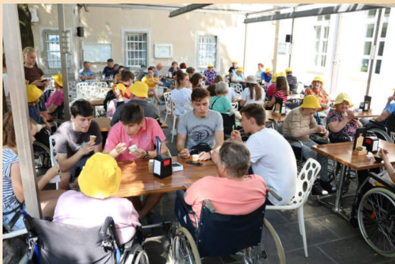
Medgeneracijski pogovor ob sladoledu. Foto: Arhiv Srednje šole Venio Pilon Ajdovščina, maj 2019.

Danes tehniko pripovedovanja zgodb lahko uporabimo za opis starih predmetov, ki jih otroci prinesejo v šolo. Lahko pa otroci zapišejo zgodbo, ki so jim zaupali stari starši. V zadnjem času se v pedagoškem procesu uporablja ena izmed tehnik pripovedovanja zgodb, ki je bila značilna na Japonskem. Gre za tehniko iz pouličnega gledališča Kamišibaj, ki deluje na način posredovanja zgodbe v kombinaciji z ilustracijo. Na polju kulturne dediščine je mogoče s Kamišibajem ohranяти in reinterpretirati vaše anekdote, pripovedke, posebneže oziroma druge lokalne specifike.