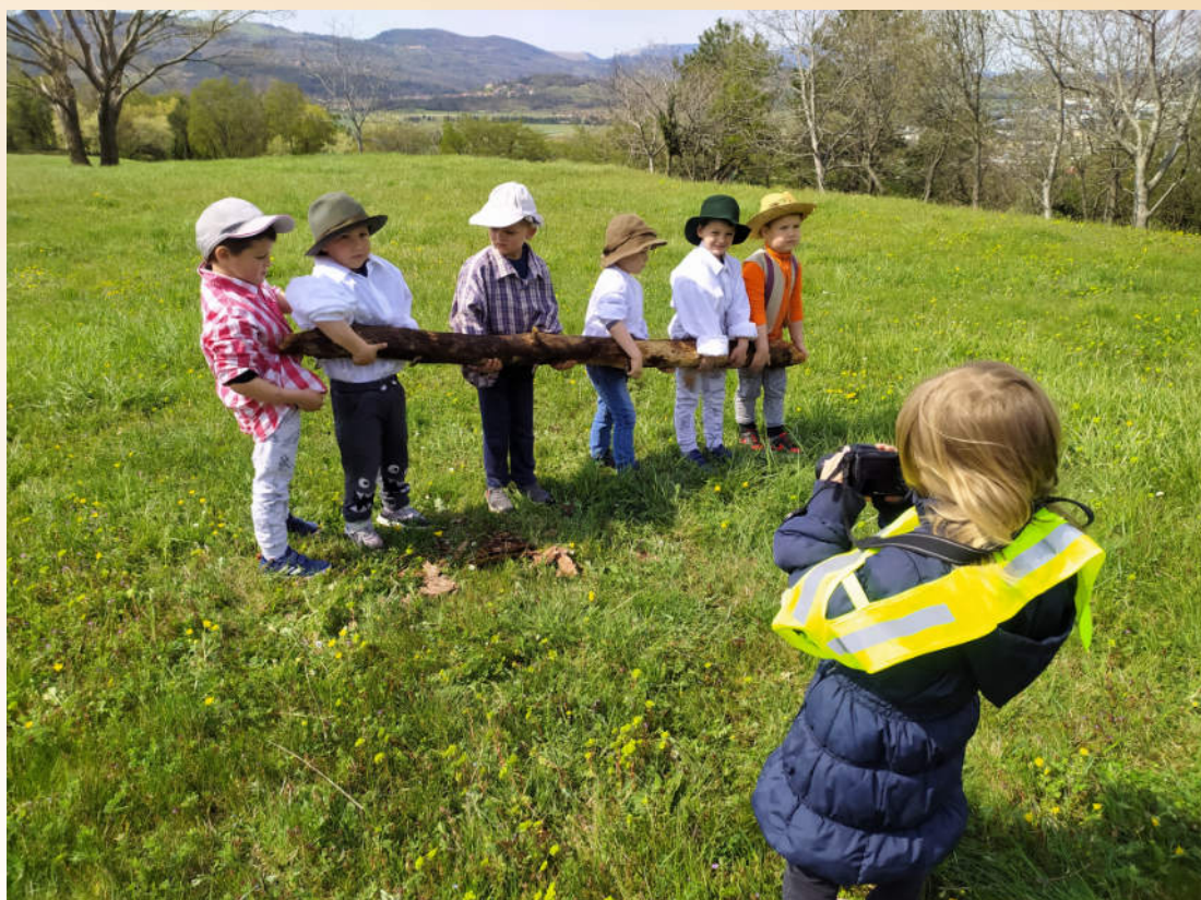
Predšolski otroci pri raziskovanju kulturne dediščine. Foto: Klavdija Mikuš, Otroški vrtec Ajdovščina, maj 2021.