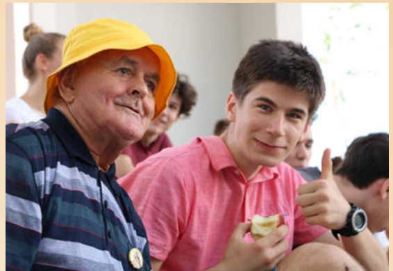
Otroci, mladi in starejši občani lahko prek različnih dediščinskih aktivnosti spletejo tesne medgeneracijske vezi in sodelovanja. Na fotografijah so dijaki iz Srednje šole Veno Pilon Ajdovščina, ki aktivno sodelujejo s starejšimi iz Doma starejših občanov Ajdovščina. Foto: Arhiv Srednje šole Veno Pilon Ajdovščina, 2019.