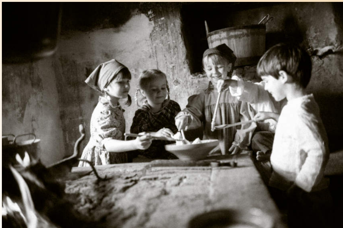
Na ognjišču ob skupni skledi leta 2021. Predšolski otroci iz Otroškega vrtca Ajdovščina, Enota Ribnik, skupina Rdeče pike pri snemanju filma Bilo je nekoč . Foto: Tadej Bernik, Lokavec, maj 2021.