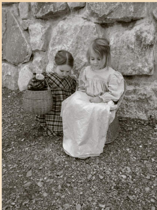
Poustvarjanje motivov, posnetih na podlagi izvorne fotografije Vena Piona (Foto: otroci iz Otroškega vrtca Ajdovščina, Enota Ribnik, skupina Rdeče pike, Žapuže, maj 2021).

Otroci fotografirajo motiv. Foto: Klavdija Mikuš, Otroški vrtec Ajdovščina Enota Ribnik, Žapuže, maj 2021.