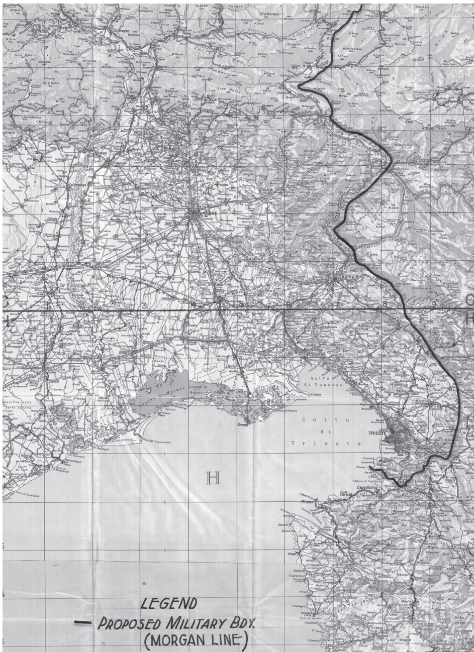
Zemljevid 1. Zemljevid z izrisano Morganovo črto v prilogi neke note z osnutkom bodočega sporazuma, ki jo je veleposlaništvo Združenega kraljestva v Beogradu poslalo 2. junija 1945. Najden v Arhivu Jugoslavije (AJ, 386 KMJ, I-3-d/17).