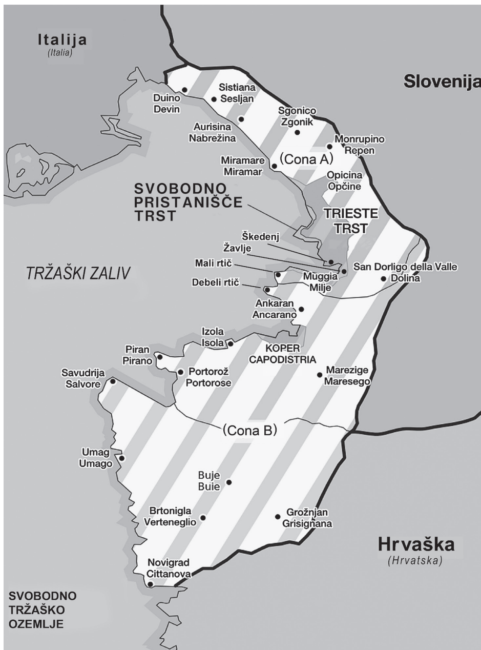
Zemljevid 3. Svobodno tržaško ozemlje (1947–1954), razdeljeno na cono A na severu, pod anglo-ameriško upravo, in cono B na jugu, pod jugoslovansko upravo.