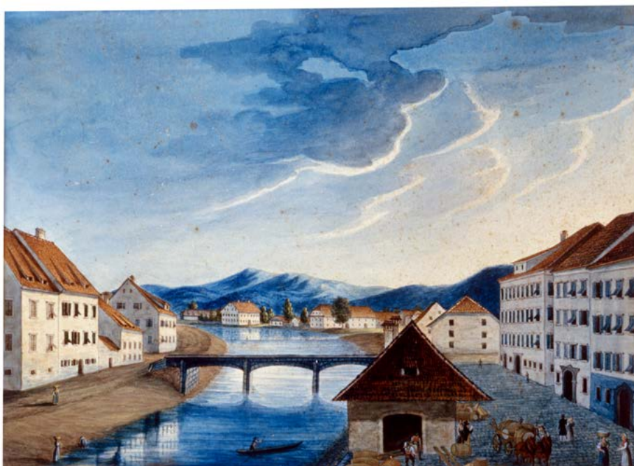
Breg s Šentjakobskim mostom, ok. 1830 (hrani Mestni muzej, inv. št. 1054).