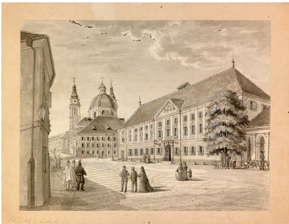
Franz pl. Kurz zum Thurn und Goldenstein: Ljubljanski licej, ok. 1840 (hrani Narodni muzej Slovenije, inv. št. R-486).

vojaški špital v nekdanjem samostanu klaris, 93 malo naprej na desni strani, na Ajdovščini, pa civilni špital s pridruženimi ustanovami, nastanjen v nekdanjem samostanu bosonogih avguštincev. 94