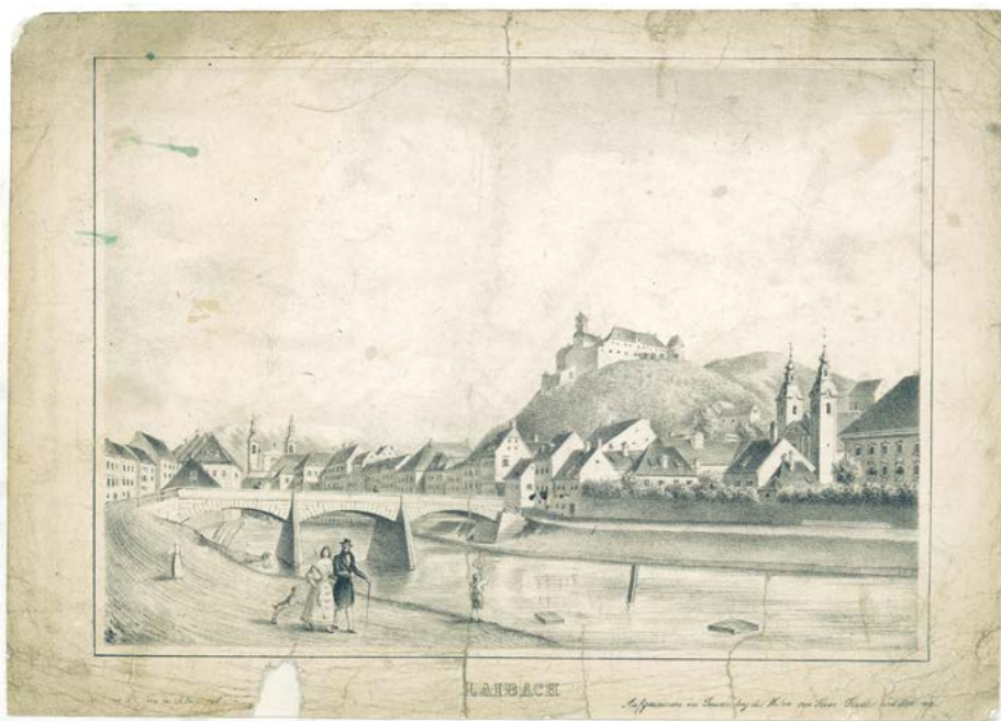
Henrik Ferstler: Šentjakobski most, 1838 (hrani Narodni muzej Slovenije, inv. št. G-2510).