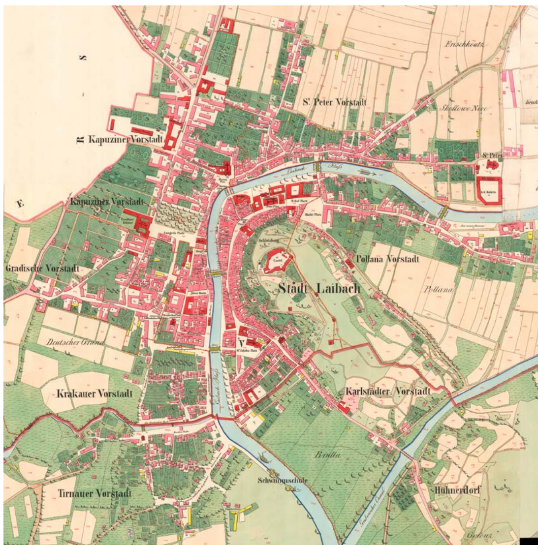
Ljubljana s predmestji na franciscejskem katastru, ok. 1840.

(1118 gospodinjstev na 314 hiš), v predmestjih pa približno četrtna manj: 12,06 prebivalca in 2,67 gospodinjstva (1594 gospodinjstev v 597 hišah). 43