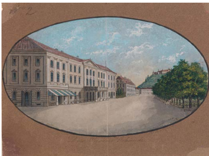
Anton Jurmann: Ljubljanska Kazina, ok. 1850 (hrani Narodni muzej Slovenije, inv. št. G-1403).

Najelitnejši plesi so bili v Kazini, kjer se je zbirala ljubljanska višja družba. Franz v pismu baronu pripoveduje o ženi nekega krojača, ki si je prizadevala, da bi mož opustil obrt in postal trgovec z blagom, da bi ona kot trgovčeva žena lahko prišla na ples v Kazino (37/154).