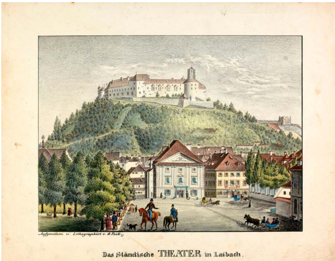
Georg Pajk po Franzu pl. Kurz zum Thurn und Goldenstein: Kongresni trg s Stanovskim gledališčem, 1836 (hrani Narodni muzej Slovenije, inv. št. G-2801, foto: Tomaž Lauko).

Ašanti, ki je pritegnil veliko radovednežev, nekateri so se dotikali njegove kože in skodranih las (34/34). Na ples v Kazino so lahko prišli tudi nečlani, če jih je pripeljal član ali če so imeli prijatelje med častniki (35/189).