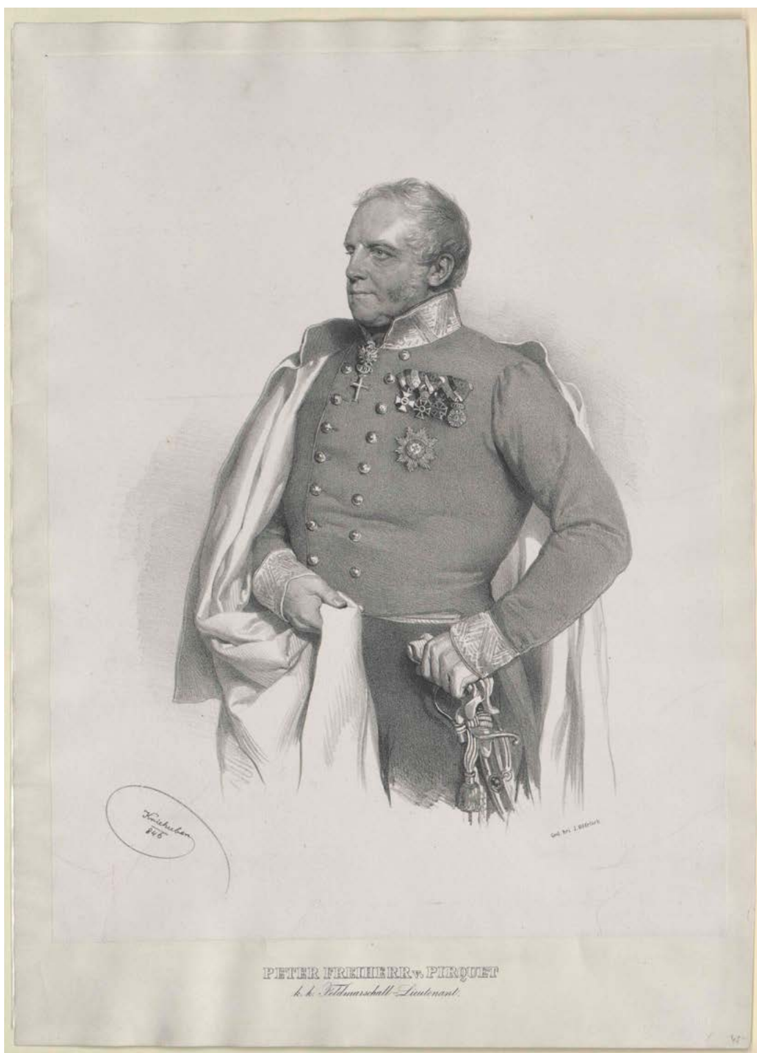
Peter baron Pirquet-Cesenatico (1781–1861) (Österreichische Nationalbibliothek, Wien, PORT_00005757_01).