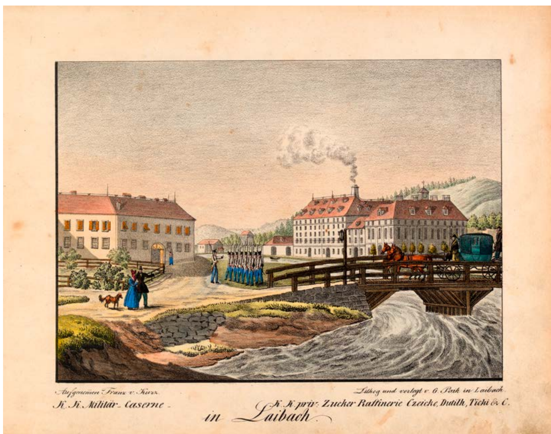
Georg Pajk po Franzu pl. Kurz zum Thurn und Goldenstein: Del Šentpeterskega predmestja s Šentpetersko vojašnico (levo) in Cukrarno (desno), 1835/1836 (hrani Narodni muzej Slovenije, inv. št. G-1558).

bila v njegovem času stavba v resnici premajhna, zato so si morali pomagati s t. i. kvazikasarno ( Quasi-Caserne ) v trnovskem predmestju. 26 Že v Lipičevem opisu mesta dobrih deset let poprej zasledimo večino omenjenih objektov, pa tudi pritožbe glede prostorske stiske: »Na voljo je le ena vojašnica in če primanjkuje prostora, kar se običajno dogaja, si je treba pomagati z nastanitvijo vojakov v zasebnih hišah.« Ob tem je Lipič dodal, da je garnizijo navadno sestavljalo moštvo dveh bataljonov, od katerih je bil vsaj en bataljon domačega polka. 27 Poleg nekaterih drugih vojaških uradov in ustanov (npr. garnizijsko vojaško sodišče, mestno poveljstvo ( Platz-Commando ), vojaška skladišča itd.), ki so delovali v Ljubljani, 28 Lipičeva Topografija omenja, da je bilo v mestu tedaj »vrhovno vojaško poveljstvo«. V resnici je bilo v Ljubljani tedaj nastanjeno »le« (višje) vojaško poveljstvo ( Militär-Commando ). 29