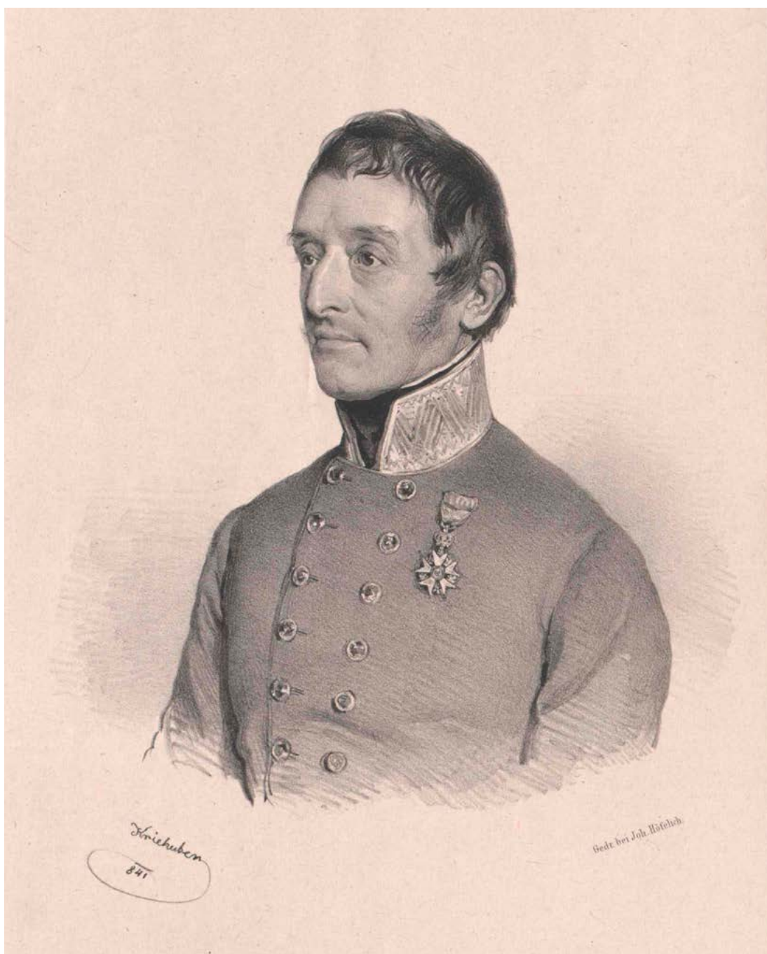
Johann pl. Sivkovich (1779–1857).