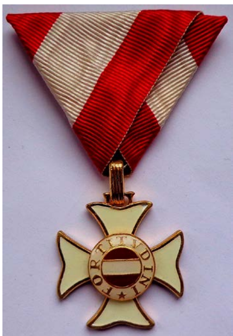
Viteški križ vojaškega reda Marije Terezije.