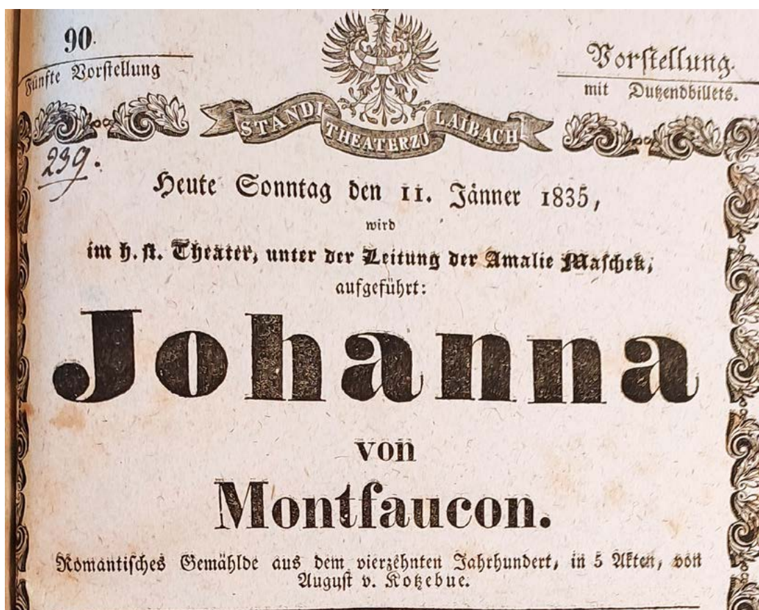
Izsek z gledališkega lepaka z dne 11. januarja 1835, ko so v Stanovskem gledališču uprizorili Kotzebuejevo romantično igro v petih dejanjih Johanna von Montfaucon (NMS, Comedien-Zettel-Sammlung, sezona 1834/35, sig. 13085).