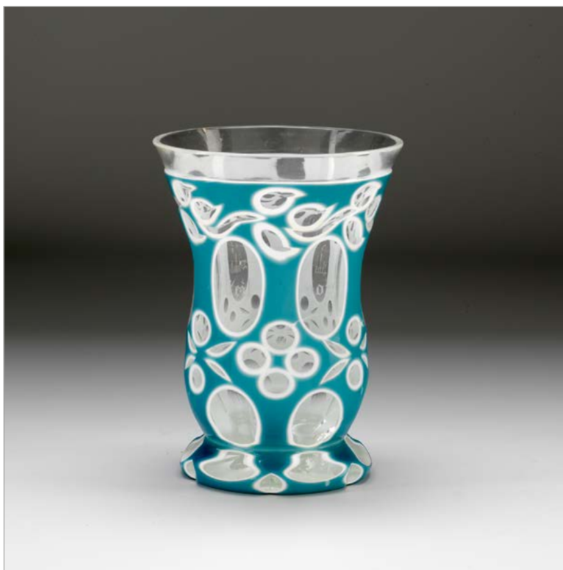
Kozarec v bidermajerskem slogu, severna Češka, ok. 1830 (NMS, inv. št. N 2144).

gravurami – namizni zvonček in pisalni komplet s figuralnim pokrovom, ki je bil hkrati prirejen za obtežilnik (37/27). Podoben, čeprav očitno ne tako izborno okrašen pisalni komplet je naveden že leto prej (36/292). Verjetno najprestižnejši skupek litoželeznih izdelkov je bil komplet zelo fino obdelanega, v celoti črno bruniranega nakita, sestavljen iz verižice s križcem, para zapestnic in para uhanov (34/67).