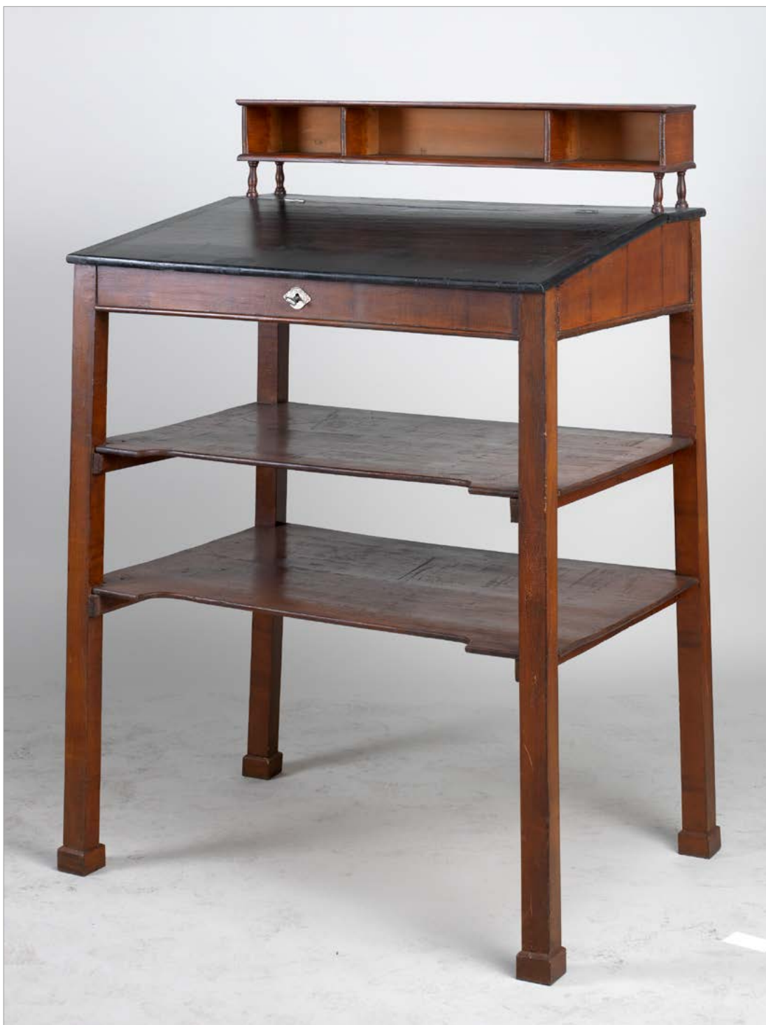
Pisalni pult iz sredine 19. stoletja, izdelan v poznem bidermajerskem slogu (NMS, inv. št. N 6787).