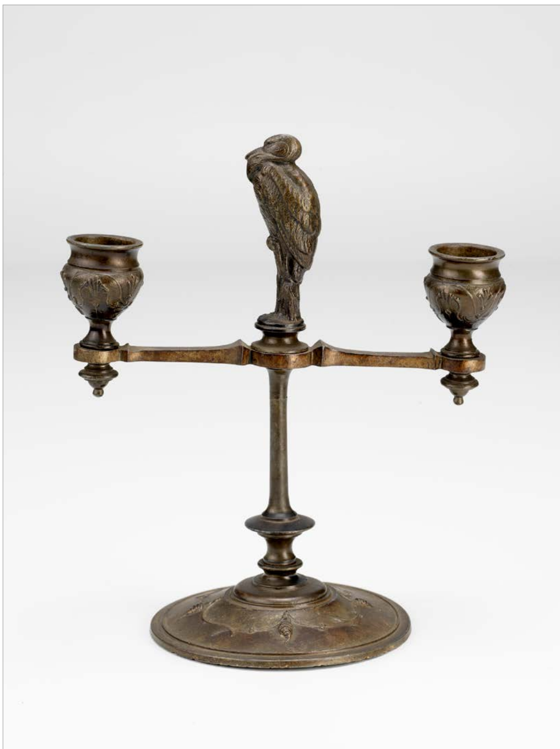
Dvojni namizni svečnik iz litega železa, prva polovica 19. stoletja (NMS, inv. št. 14006).