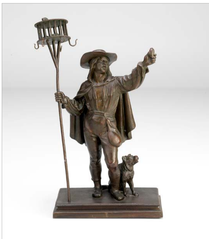
Litoželezni obešalnik za nakit s figuro savojskega cestnega prodajalca podganjega strupa in lovca na glodavce (NMS, inv. št. N 4871).

brušenega stekla, opremljen s srebrnim pokrovom in krožnikom, trgovec Valentin Pleiweis iz Kranja, oče narodnega buditelja Janeza Bleiweisa, pa zlato zapestnico po »najnovejši modi« (40/7).