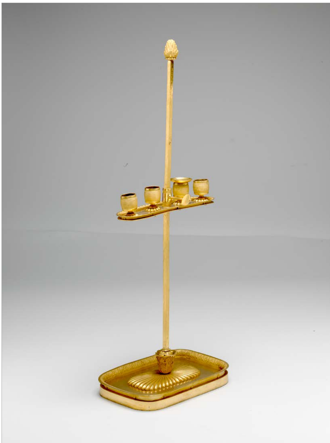
Četverni namizni svečnik iz zapuščine Franceta Prešerna, prva četrtina 19. stoletja (NMS, inv. št. 14025, foto: Tomaž Lauko).