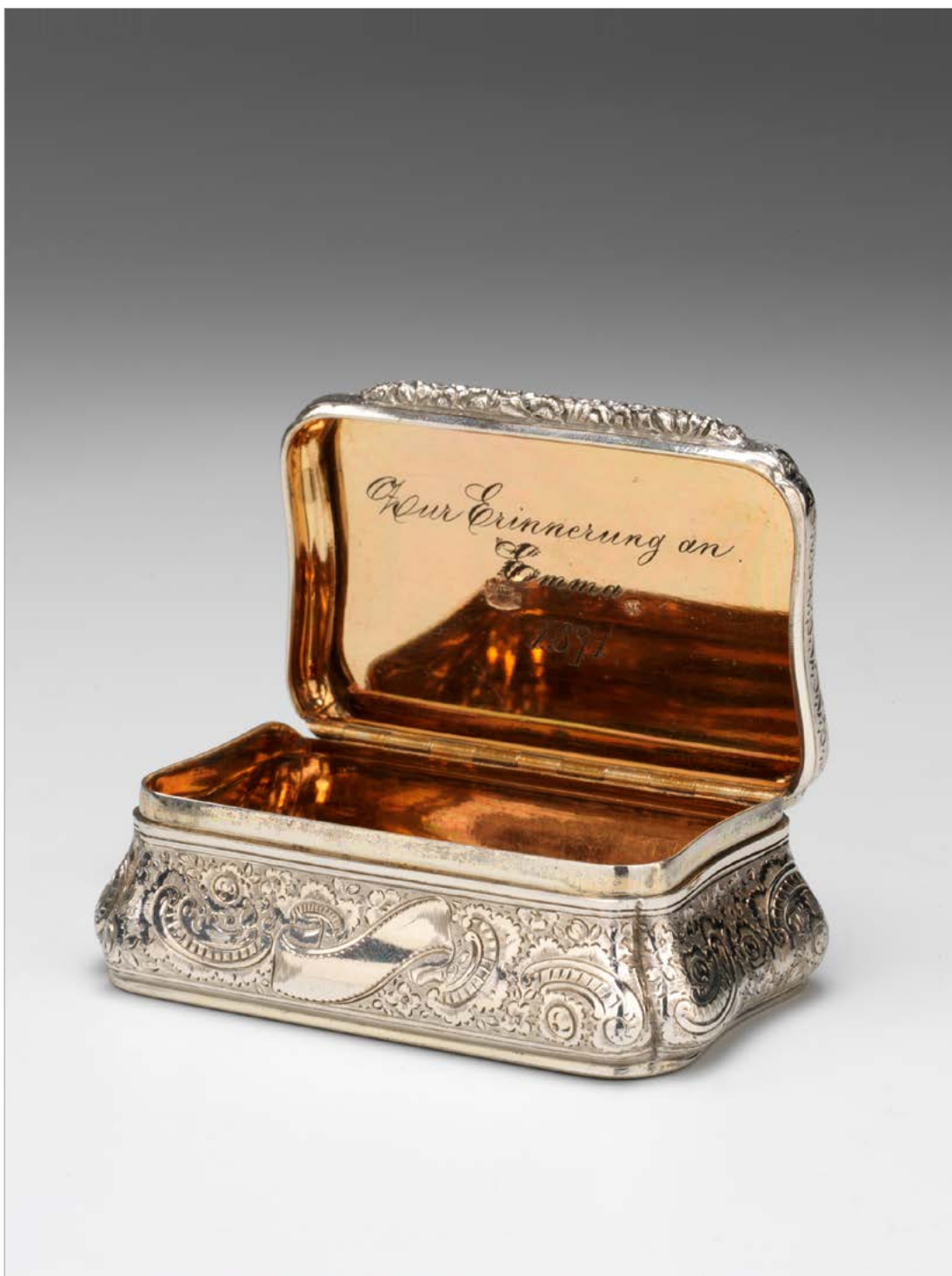
Srebrna šatulja za nakit, Mathias Kral, Praga, 1846 (NMS, inv. št. N 15476).