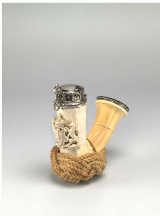
S srebrom okovani pipi iz morske pene, Budimpešta oziroma Ogrska, sredina oziroma druga polovica 19. stoletja (NMS, inv. št. N 38644, N 38647).

Enak izdelek je dokumentiran še enkrat pozneje (38/53), medtem ko je leta 1837 zabeleženo srebrno držalo z ustnikom iz pušpanovega lesa in srebrno škatlico za vžigalnik (37/56).