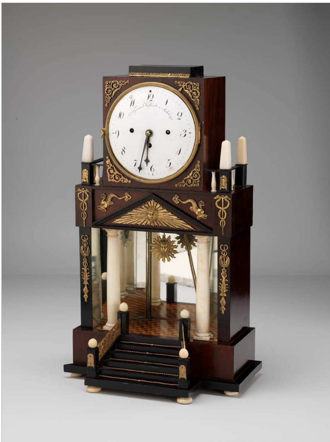
Portalna namizna ura s parom alabastrnih stebričev, izdelek mariborskega mojstra Janeza Nepomuka Wolfharta, ok. 1820 (NMS, inv. št. N 9275).