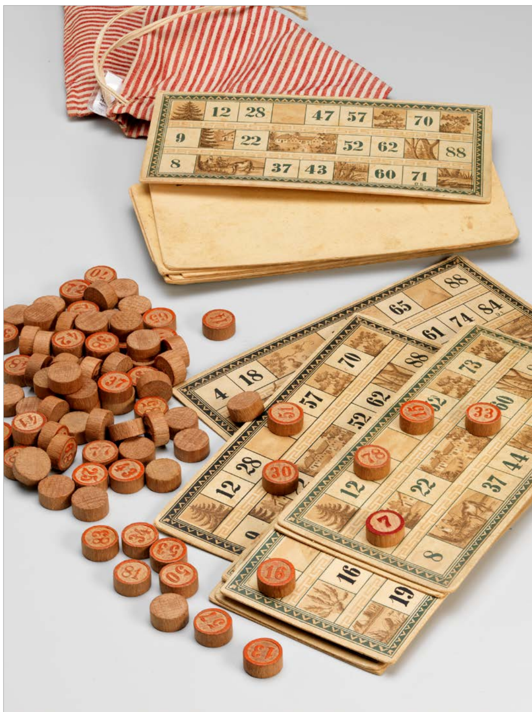
Igralni komplet za tombolo s kartami in žetoni, začetek 20. stoletja (NMS, inv. št. N 1799).