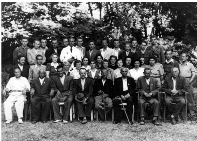
Skupinska fotografija povratnikov iz koncentracijskih taborišč na vrtu Walyjeve vile v Murski Soboti leta 1945.

Tudi zato, predvsem pa zaradi dejstva, da je bila judovska preteklost Prekmurja odkrita šele tik pred prelomom tisočletja, zaradi česar čaka raziskovalke in raziskovalce na tem področju še veliko dela, namesto običajnega sklepa ponujam nabor odprtih vprašanj in eno najbolj žalostnih fotografij v zgodovini Prekmurja.