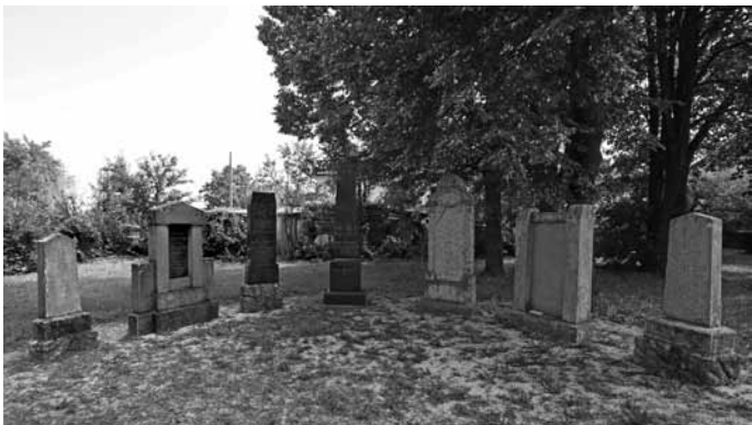
Spominsko obeležje na mestu nekdanjega judovskega pokopališča v Murski Soboti.