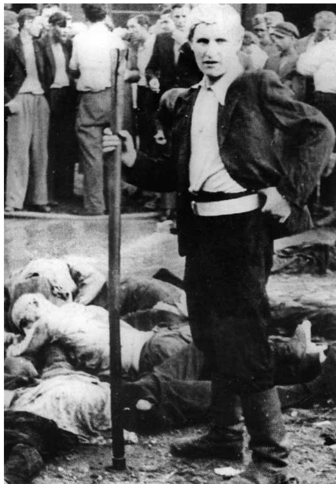
Poboj Judov v Vilni leta 1941.

Zato se ne moremo strinjati z Ericom Hobsbawmom, ko pravi, da se je v Berlinu antisemitizem razširil po ukazu od zgoraj. Res pa je, da novoveška Nemčija pred novembrom 1938 ni poznala dogodkov, ki bi bili kakor koli primerljivi s pogromom v Kišinjevu leta 1903 ali masovnimi poboji Judov med rusko revolucijo leta 1905. Da surovega poboja 3.800 Judov, ki so jih po prihodu Nemcev dobesedno potolkli Litovci sami, niti ne omenjamo. 28